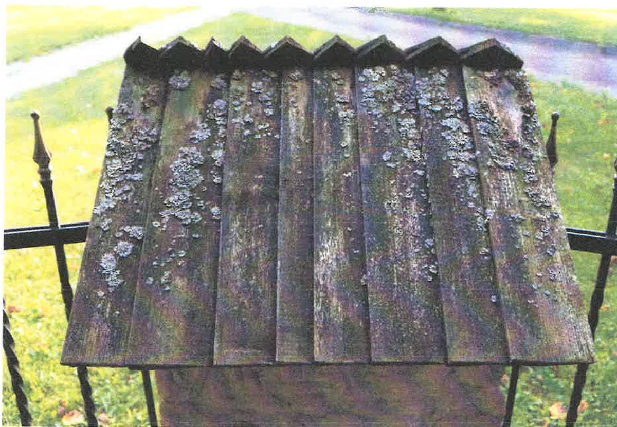
Fot. Daszek na ogrodzeniu