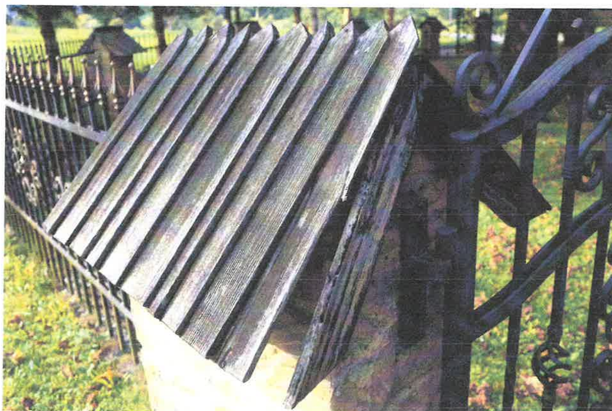
Fot. Daszek na ogrodzeniu