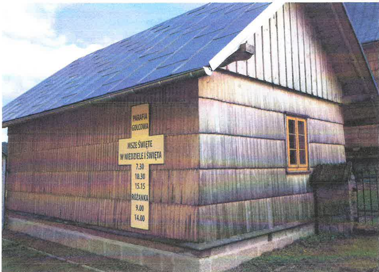
Fot. Zabytkowy budynek lamusa